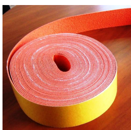
РИФЕЛОВАНА ГУМЕНА ЛЕНТА ЗАДВИЖВАЩ ВАЛ