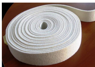
ПОКРИТИЕ NОMЕХ ПРИТИСКАЩ ВАЛ