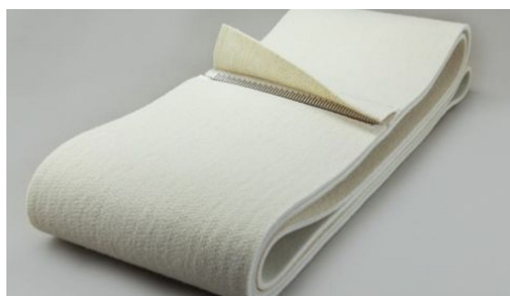
ГЛАДАЧНИ ЛЕНТИ NОMЕХ